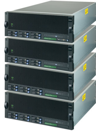
Power 770 모듈형 빌딩 블록

최대 64개의 POWER7™ 프로세서 코어로 구성할 수 있는 이 새로운 버전의 대중적인 모듈형 설계는 이전 모델보다 더욱 뛰어난 효율성으로 더욱 많은 용량을 제공합니다. 결과적으로 시스템당 성능 및 풋프린트당 성능이 증가했으며 무엇보다도 와트당 성능이 향상되었습니다. 또한 이 혁신적인 설계 방식은 선형에 가까운 확장 및 무중단 확장을 지원하므로 투자를 최대화할 수 있습니다. POWER7 기술, PowerVM 가상화, Power 770은 고객의 IT 환경에 맞는 최적의 조합이 될 것입니다.